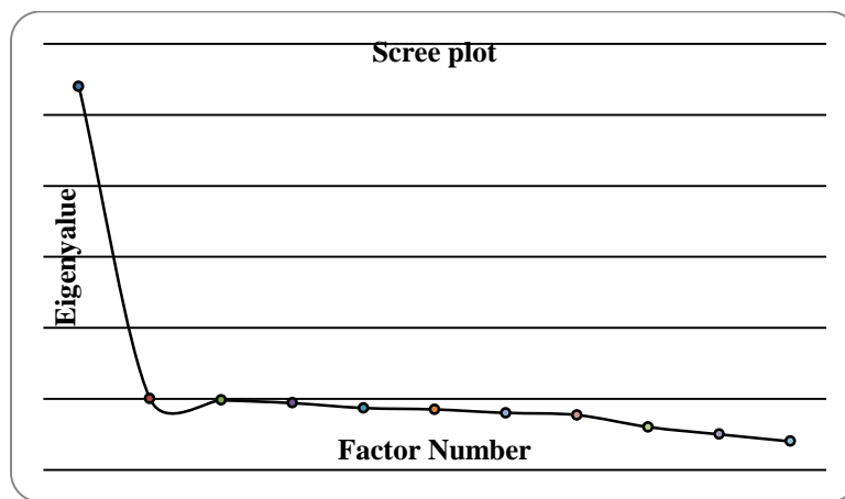
نمودار ۱. سنگ ریزه ساختار عاملی مقیاس سندرم پیش از قاعدگی

معناداری اطلاعات موجود در یک ماتریس از طریق آزمون مربع کای بارتلت صورت می‌گیرد که معنادار بودن این آزمون حداقل شرط لازم برای انجام دادن تحلیل عاملی است. در آزمون بارتلت فرض صفر این است که متغیرها فقط با خودشان همبستگی دارند و رد فرض صفر حاکی از آن است که ماتریس همبستگی دارای اطلاعات معنادار است و حداقل شرایط لازم برای انجام دادن تحلیل عاملی وجود دارد. در این مطالعه مقدار آزمون کرویت بارتلت (\chi^2=450/13, P=0/001) با درجه آزادی ۵۵ نشان داد که این مفروضه برقرار است و حداقل شرط برای انجام تحلیل عاملی برقرار است. بعلاوه نتایج نشان داد مقدار شاخص کفایت نمونه برداری کیسر