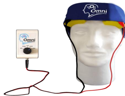
شکل ۲. نحوه قرارگیری الکترودها بر روی سر (برگرفته از سایت

کنندگان بعد از قرارگیری در گروه‌ها، پیش‌آزمون‌ها را تکمیل نموده و سپس گروه آزمایش، با توجه به ملاحظات اخلاقی، مورد مداخله پژوهشی بر طبق پروتکل معرفی شده قرار گرفتند. بعد از اجرای مداخله مجدداً از گروه‌ها پس‌آزمون گرفته شد. سپس مراحل جمع‌آوری و تفسیر داده‌ها صورت گرفت. پس از اتمام پژوهش و اثبات تأثیرگذار بودن درمان، گروه گواه نیز درمان مورد نظر را در طی یک دوره دو ماهه دریافت نمود.