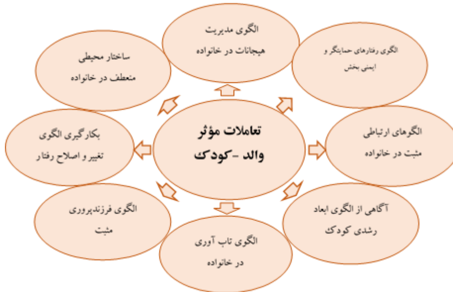
شکل ۱. الگوی تعاملات مؤثر والد - کودک ویژه کودکان پیش از دبستان (۴ تا ۶ سال)