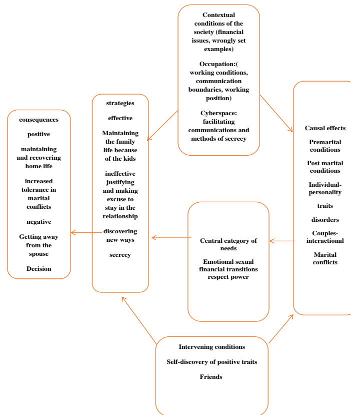
Figure 1. The paradigm of the underlying factors of marital infidelity