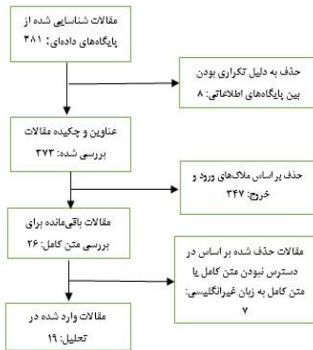
Figure 1: the process of reviewing and selecting articles (decision tree).

fifth stage was to compare the key concepts extracted from each study with the key concepts of other studies, and finally in the last stage, the final result of meta-analysis (i.e. the factors involved in women's perception of femininity) was presented in six different aspects.