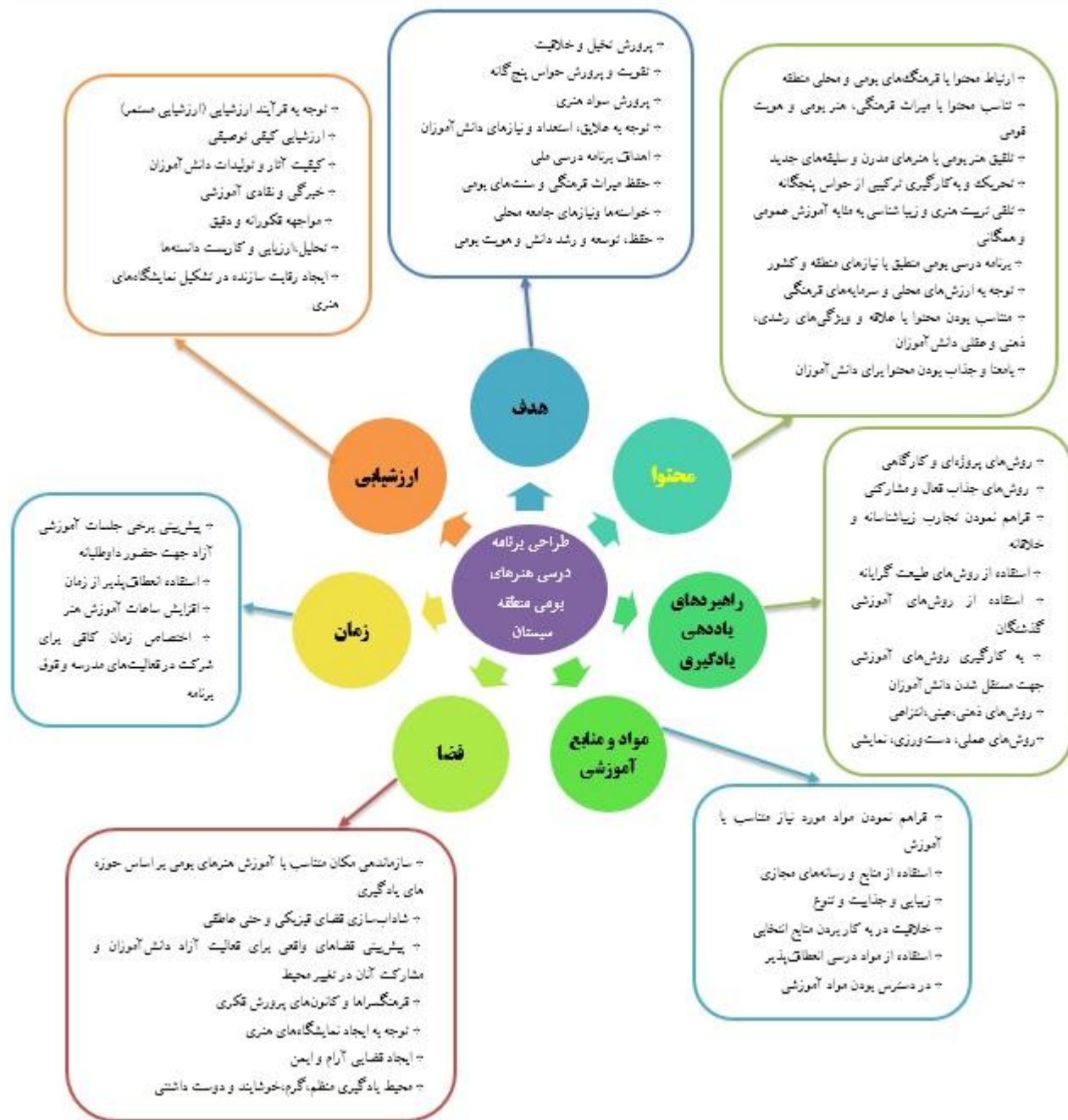
جدول ۲. الگوی پیشنهادی برنامه درسی هنرهای بومی منطقه سیستان

با توجه به مؤلفه‌های شناسایی شده، الگوی پیشنهادی برنامه درسی هنرهای بومی منطقه سیستان به صورت ذیل ترسیم شده است: